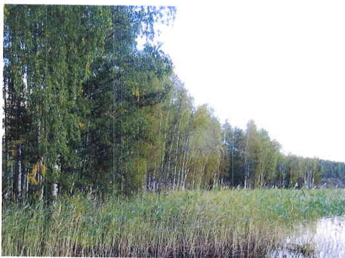
Kuva 7. Sarkasen läntisen muutoskohteen rantaa kaakkoon päin kuvattuna.