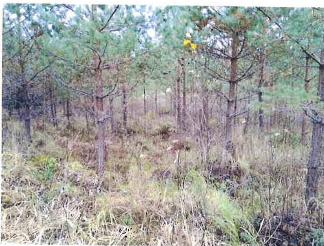
Kuva 1. Muutoskohteen rinnenmetsää.

Kortejärven muutoskohde on järven kapeassa itäpäässä. Muutoskohde on melko loivasti laskevaa harjusoramaata. Rannan tuntumassa maaperä on tasaista, lähes järven pinnan tasossa olevaa soistunutta maata. Rinnemaan mäntyvaltainen taimikko todettiin lajistoltaan tavanomaiseksi tuoreeksi kankaaksi (Kuva 1.). Rantatasanteen turvemaa todettiin lajistoltaan tavanomaiseksi varpusrämeeksi. Puustoa rannan tuntumassa on harvennettu. Kortejärven itäpään vesi on ruskeaa, muutoskohteen ranta- ja vesikasvillisuus indikoi dystrofista vettä (Kuva 2.). Rannan kasvilajisto todettiin tavanomaiseksi. Liito-oravaa, merkkejä liito-oravan oleskelusta tai liito-oravalle soveliasta elinympäristöä ei muutoskohteella todettu.