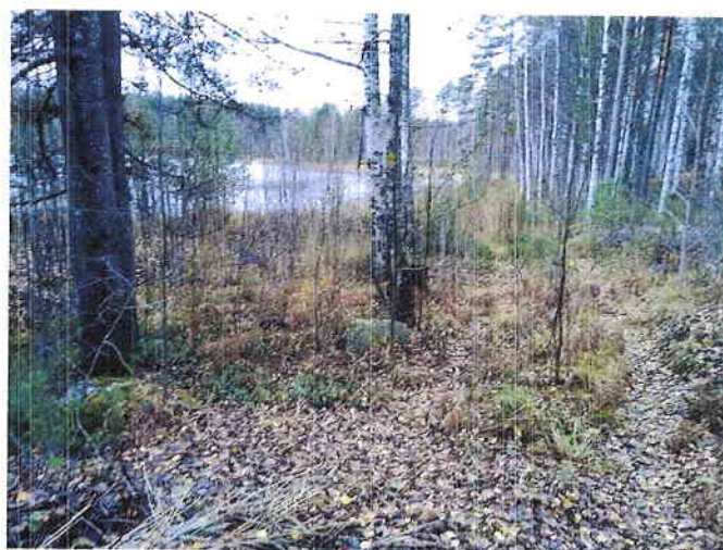
Kuva 8. Sarkasen itäisen kohteen alavaa rantaa länteen päin kuvattuna.

Suositus. Alueella ei todettu rauhoitettuja tai uhanalaisia kasvilajeja, uhanalaisia lintulajeja tai uhanalaisille lajeille (direktiivin IV(a) lajit) soveltuvia elinympäristöjä, muita luontoarvoja tai sellaisia luontotekijöitä, jotka olisi erityisesti huomioitava maankäytön suunnittelussa.