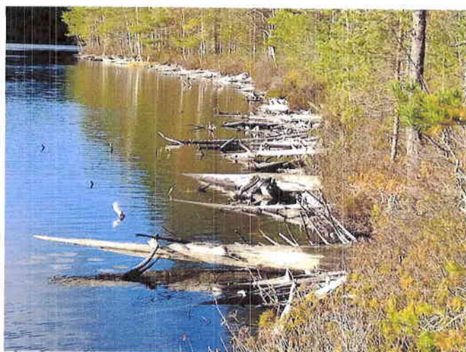
Kuva 6. Pitkäjärven muutoskohteen rämerantaa hakoineen.

Suositus. Alueella ei todettu rauhoitettuja tai uhanalaisia kasvilajeja, uhanalaisia lintulajeja tai uhanalaisille lajeille (direktiivin IV(a) lajit) soveltuvia elinympäristöjä, muita luontoarvoja tai sellaisia luontotekijöitä, jotka olisi erityisesti huomioitava maankäytön suunnittelussa.