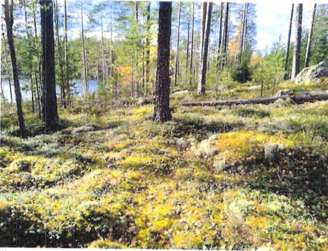
Kuva 3. Särkijärven pohjoisrannan muutoskohteen kuivaa kangasmetsää (VT) länteen päin kuvattuna.