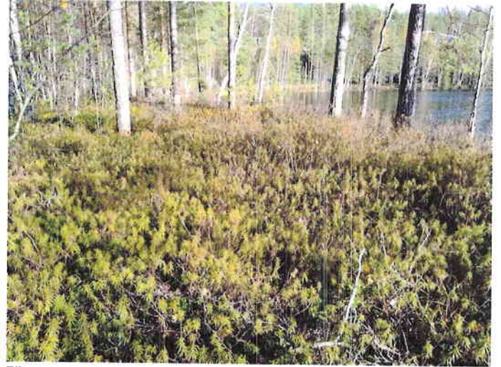
Kuva 4. Isovarpurämettä muutoskohteen itäosan rantatasanteella.

Suositus. Alucella ei todettu rauhoitettuja tai uhanalaisia kasvilajeja, uhanalaisia lintulajeja tai uhanalaisille lajeille (direktiivin IV(a) lajit) soveltuvia elinympäristöjä, muita luontoarvoja tai sellaisia luontotekijöitä, jotka olisi erityisesti huomioitava maankäytön suunnittelussa.