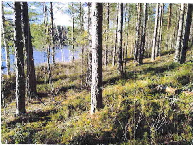
Kuva 5. Muutoskohteen rinnemetsää (MT/VT) Pitkäjärven koillisrannassa.

Pitkäjärven muutoskohde on matalaa soraharjua järven koillisrannalla. Harjuriinne muodostaa rantatasanteen, joka on soistunut. Harjumetsä todettiin nuoreksi mäntyvaltaiseksi tuoreeksi kankaaksi (MT), paikoin harjun lakiosalta myös kuivaksi kankaaksi (VT) (Kuva 5.). Ranta on rämeinen (Kuva 6.) ja kaakkoispään leveämpään osaan rantatasannetta on muodostunut kookasta mäntyä kasvava isovarpuräme, joka on ojitettu. Muutoskohteen ranta on hakojen peittämä. 1800/1900 -luvun vaihteessa alueella on ollut kova myrsky, joka kaatoi rantametsiä järveen. Haot ovat jääne tästä myrskystä (Kuva 6.). Ranta on pääosin mutapohjainen, vesi on ruskeaa ja vesikasvilajisto indikoi dystrofista vettä. Vesikasvilajistossa oli todettavissa hieman myös järviruokoa. Alueen kasvilajisto todettiin tavanomaiseksi kangasmetsien, rämeiden ja dystrofisten vesien lajistoksi. Liito-oravaa, merkkejä liito-oravan oleskelusta alueella tai liito-oravalle soveliaista elinympäristöä muutoskohteella ei todettu.