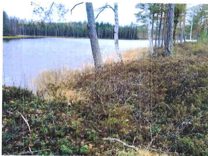
Kuva 2. Kohteen rämerantaa länteen kuvattuna.

Suositus. Alueella ei todettu rauhoitettuja tai uhanalaisia kasvilajeja, uhanalaisia lintulajeja tai uhanalaisille lajeille (direktiivin IV(a) lajit) soveltuvia elinympäristöjä, muita luontoarvoja tai sellaisia luontotekijöitä, jotka olisi erityisesti huomioitava maankäytön suunnittelussa.